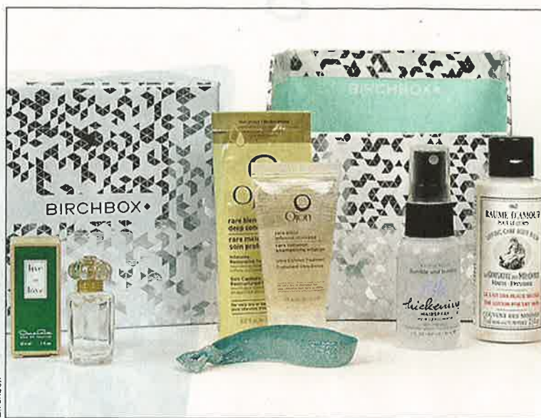
A l'intérieur des colis, des produits à découvrir autour de la thématique choisie.